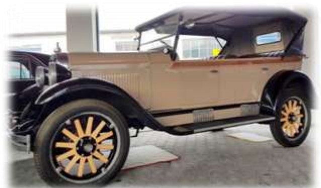
Oldtimer Autohaus Smit mit Schucu Werkstattmatte