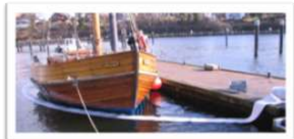
25 m Ölsaugsperrgurt, Ölwehrsicherung vom Bach bis zum Meer