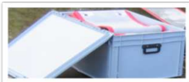
25 m Ölsaugsperrgurt in Koffer- Box (L*B*H cm = 80 * 60 *43

Referenzen: Marine Kiel/Eckernförde, Landesküstenschutz SH, Bremen, Riga uvm.