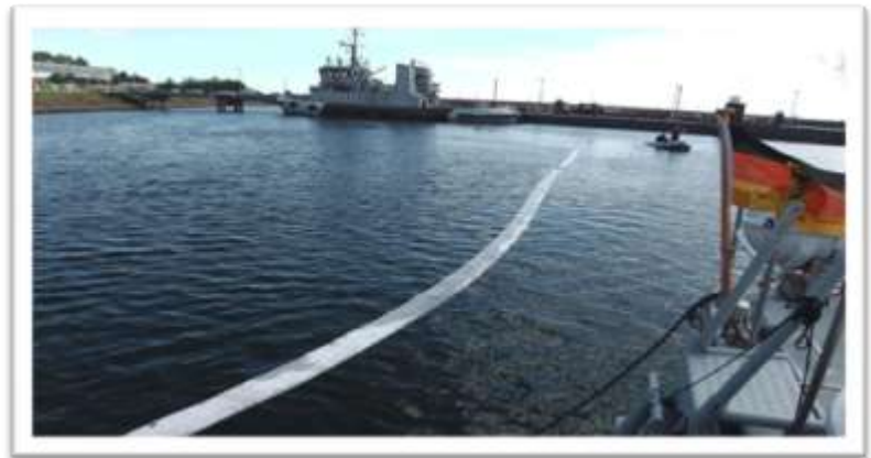
Ölsauggürtel Marine Kiel

Handhabung: Sperrgürtel einfach mit kleinem Motorboot oder per Hand auf volle Länge ausrollen und Verunreinigung einsperren. Dünnere Ölschlieren werden auch bei Strömung direkt aufgenommen, bei größeren Verunreinigungen in Kombination mit Schucu Gewässermatte anwenden.