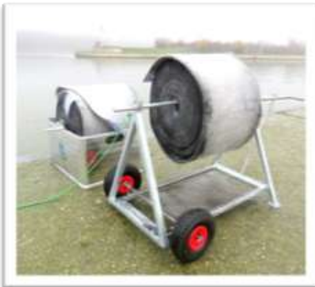
Donau Wien: Ölsauggürtel

Ölbindekraft: 1 qm bindet bis ca. 8 L Öl.